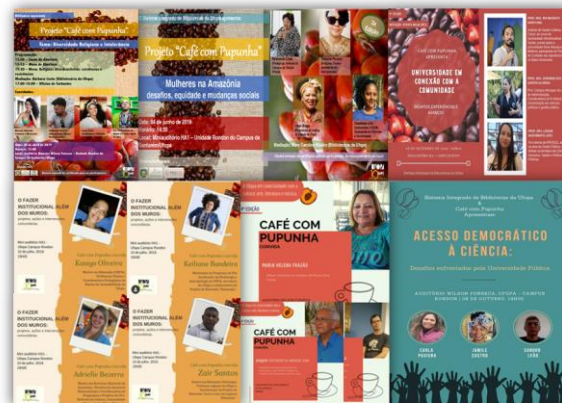
Figura com as imagens dos cartazes de divulgação.