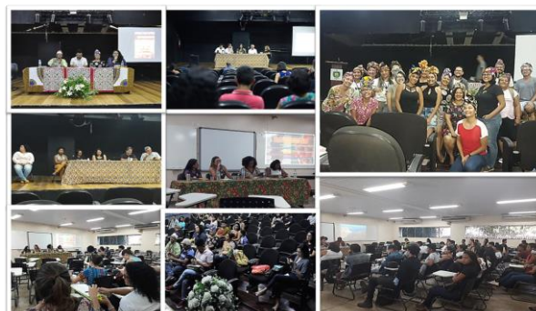
Figura com registros das edições.